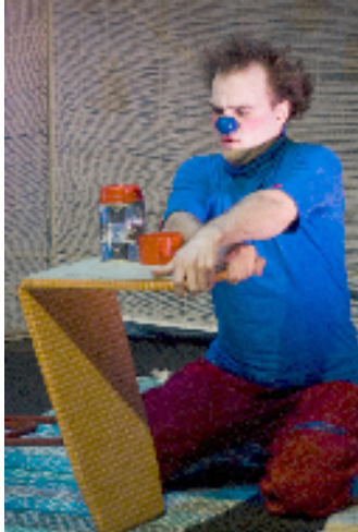
Klovni, jonka nenä oli sininen.

toiminnan kustannuksiin ylimääräisessä jaossaan vuoden lopussa 1000 euroa. Apurahalla maksettiin toimiston, esitysten ja festivaalin materiaalikuluja.