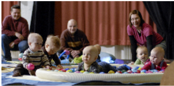
Vau vanne. Kuva: Joonas Martikainen 2008.

Tavoitteenamme oli tehdä mielenkiintoisia, omaperäisiä ja huolellisesti valmistettuja esityksiä erilaisille yleisöille. Mielestämme onnistuimme tässä. Jokaisella esityksellä on erilainen kohderyhmänsä ja erilaiset taiteelliset tavoitteet. Esitysten ohjaus, esiintyminen ja scenografia olivat korkeatasoisia, vaikkakin pienellä budjetilla tehtyjä.