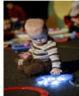
Vau vanne.

Yleisötavoite ensimmäiselle vuodelle oli noin 40 esitystä ja noin 1200 katsojaa. Näistä jäätin kauas. Esityksiä oli Rovaniemellä vain viisi kulttuuritalo Wiljamissa. Havaittiin myös, että esityksen maksimikatsojamäärä on 10–15 vauvaa perheineen. Yhden vauvan mukana tuli yleensä yksi tai kaksi aikuista (vanhempia tai isovanhempia) ja toisinaan isompia sisaruksia. Katsojia viidessä esityksessä oli yhteensä noin 105.