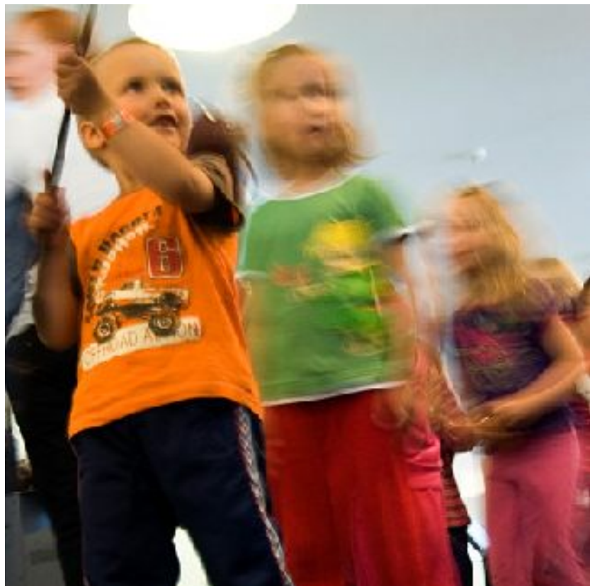
Runo-ongintaa. Kuva: Joonas Martikainen 2010.

Viimeinen keskiviikko järjestettiin Hevosajelua ja pihaleikkejä -teemalla 21.7. Lauri-tuotteen pihalla. Osallistujia alkoi olla resursseihin nähden jo liikaakin, 600. Klovni Klementtiini avasi jälleen tapahtuman. Sen jälkeen sai omaan tahtiin osallistua Turinatuokioihin, Taiga-