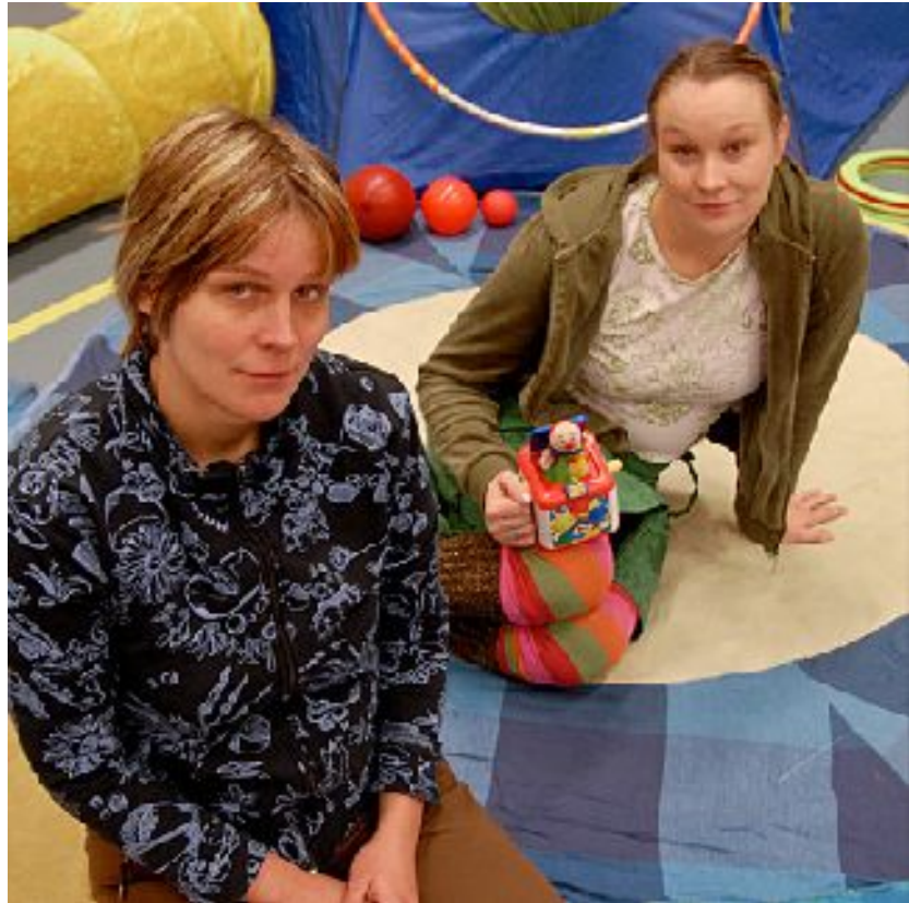
Vau vanteen tekijät.

Vuonna 2008 ensi-iltansa saanut, vauvoille ja vauvaperheille suunnattu sirkusesitys Vau vanne esitettiin keväällä Helsingissä ja kiersi syksyllä Lapin pienissä kunnissa. Esityksiä oli yhteensä viisi ja katsojia 96. Katsojakeskiarvo oli siis 19,2, mikä on esityksen ominaispiirteet huomioiden hyvä. Jokaisen esityksen jälkeen pidettiin pieni sirkustyöpaja, joissa vauvat, muut lapset ja vanhemmat oppivat yhdessä tehtäviä sirkusharjoitteita ja leikkivät esityksen lavasteilla. Keikoilla oli mukana Mette Ylikorva esiintyjänä ja Riikka Vuorenmaa scenografina.