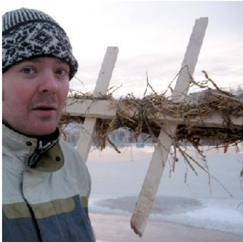
Jokivalkeat.