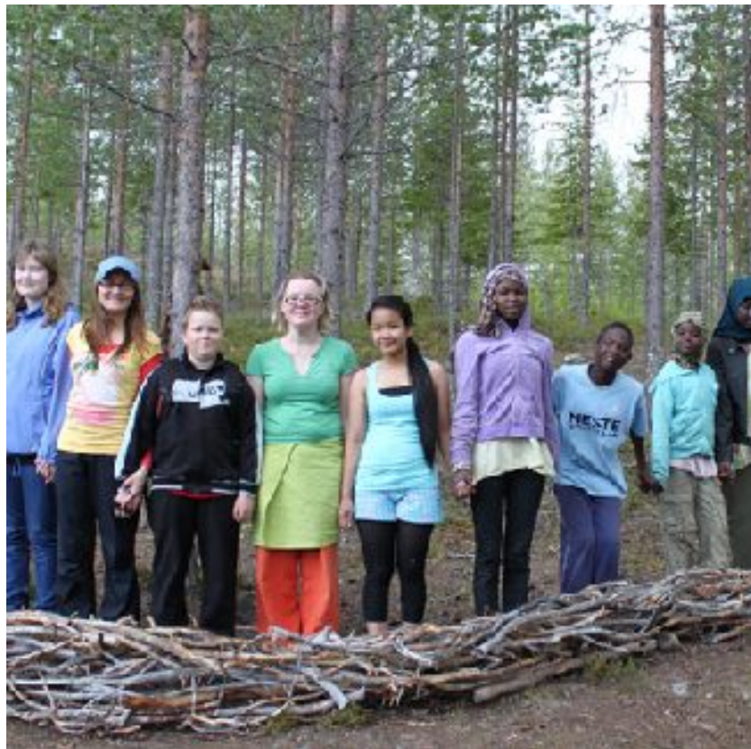
Taide merkinä.

Työryhmä järjesti Taide merkinä -kuvataideleirin 9.-12.6. Rovaniemen kaupungin myöntämällä apurahalla. Leirin avauspäivänä tehtiin päiväretki Oranki Art -ympäristötaidetapahtumaan Pelloon. Päivän aikana nuoret toteuttivat symbolistisen käärmeen ja linnunpesän. Kolmen seuraavan päivän aikana kotiuduttiin Pöykkölän kotiseutumuseon pihapiiriin, jossa toteutettiin mm. ulkoilmamaalauksia ja havaintopiirroksia. Leiri huipentui lauantaina piknik-päivään, jonka lomassa tehtiin pieniä taideteoksia neulahuovuttamalla.