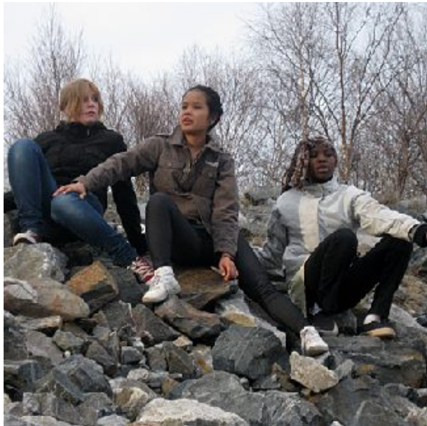
Kohtaamisia Utsjoella.

Suomen Kulttuurirahaston Myrsky-hankkeen Kohtaamisia-projektille vuonna 2008 myöntämää kolmivuotista avustusta oli käytössä 20 000 euroa. Rovaniemen kaupunki myönsi 2500 euroa kohdeavustusta Kohtaamisten esityksen valmistamiseen. Opintokeskus Kansalaisfoorumi antoi Kohtaamisille kurssitukea yhteensä noin 3000 euroa. Kohtaamisia oli Pisteen suurin työllistäjä, joten avustuksilla maksettiin palkkoja useiden eri taiteenalojen ohjaajille. Nuoret myös osallistuivat taidefestivaaleille ja kävivät katsomassa esityksiä. Lisäksi muun muassa hankittiin sirkusvälineitä ja esiintymispukuja sekä maksettiin tilavuokria.